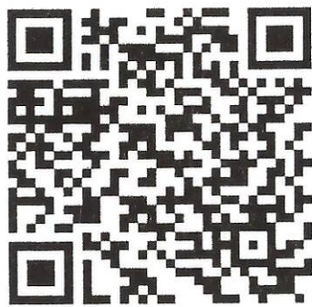
2019 年 12 月號「康樂校訊」

如各家長及同學想了解更多，可掃描下方 QR Code，參閱 2019 年 12 月號「康樂校訊」中校長的話及<校長的話 2019>校長的話(一) -- 題目：Follow Your Dreams。